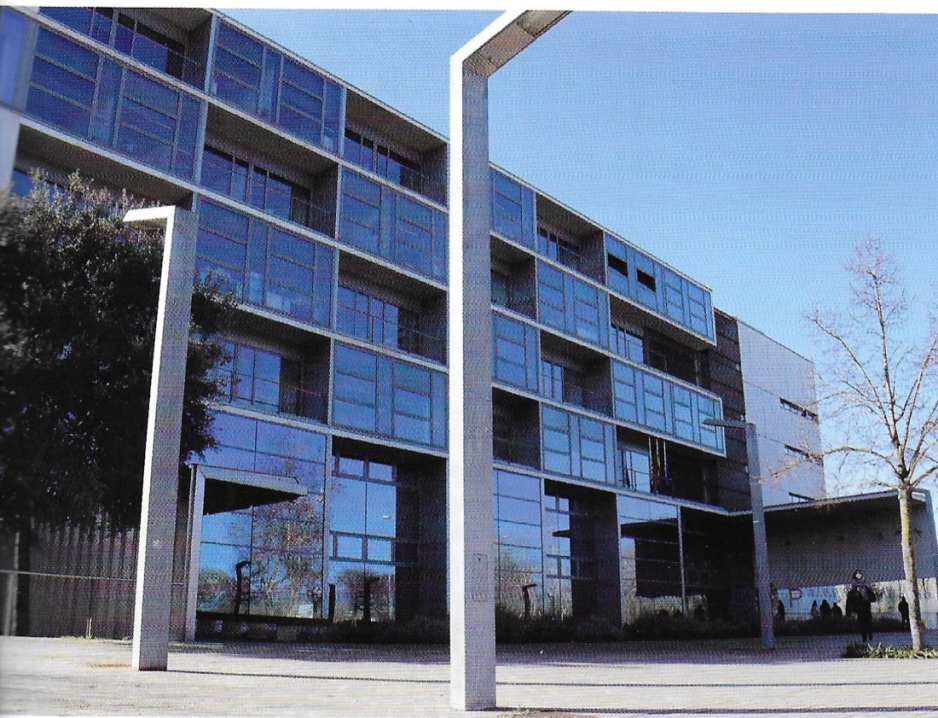
>> Façana del Palau de Justícia de Girona.

A les comarques gironines, aquest percentatge s'enfila fins al 17,04 % (3.185 de les 18.689 sentències). La dada més alta de Catalunya, sí, tot i que no s'equipara, ni de lluny, amb la de l'ús del castellà. Fent una mica de retrospectiva, hi ha hagut un increment de les sentències dictades en català d'un any per l'altre, perquè el 2019 en van ser el 15,51 % (3.743 de