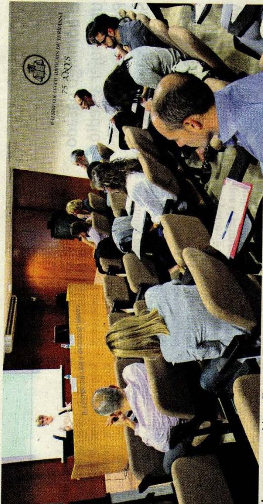
Primera proyección se llevará a cabo en la sala de actos del Col·legi d'Advocats.

Este lunes se celebra la primera sesión en su sede