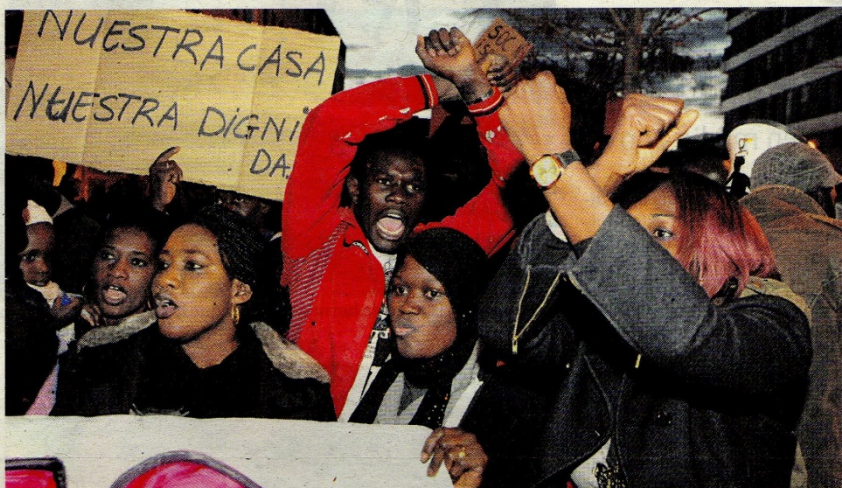
Manifestación realizada en Terrassa el viernes 21 de febrero en contra de las redadas. PEP MASIP

Las dos comisiones del Col·legi d'Advocats de Terrassa entienden que la actuación de la Policía Nacional fue "absolutamente discriminatoria", al estar dirigida únicamente al colectivo de ciudadanos de origen senegalés. "No queremos pensar que la actuación tuvo lugar siguiendo órdenes de la superioridad para acabar de llenar un avión con destino a Senegal", un avión con senegaleses expulsados tras ser detenidos en diversas partes de España. El transporte estaba programado para el jueves 13 de febrero y llenarlo de via-