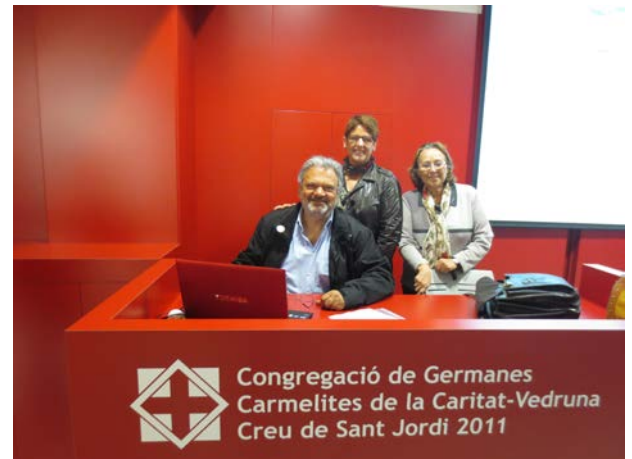
Sessió divulgativa a les escoles. Escola Vedruna. 26 de maig de 2014