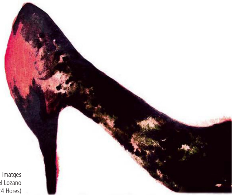
Il·lustració basada en imatges de Mabel Lozano (Projecte Noies Noves 24 Hores)

orgànica 4/2000, d'11 de gener, i els seus instruments de desenvolupament.