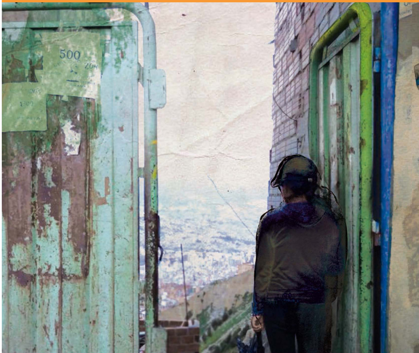
Il·lustració basada en imatges de Mabel Lozano (Projecte Noies Noves 24 Hores)